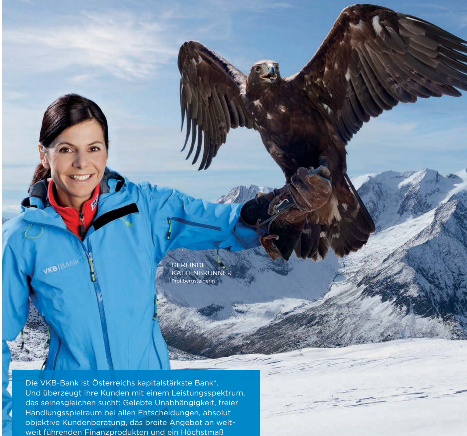
GERLINDE KALTENBRUNNER Profiberbesteigerin

Die VKB-Bank ist Österreichs kapitalstärkste Bank*. Und überzeugt ihre Kunden mit einem Leistungsspektrum, das seinesgleichen sucht: Gelebte Unabhängigkeit, freier Handlungsspielraum bei allen Entscheidungen, absolut objektive Kundenberatung, das breite Angebot an weltweit führenden Finanzprodukten und ein Höchstmaß an Kundenorientierung. Vorteile, die Ihnen Rückenwind verschaffen und beste Perspektiven bringen.