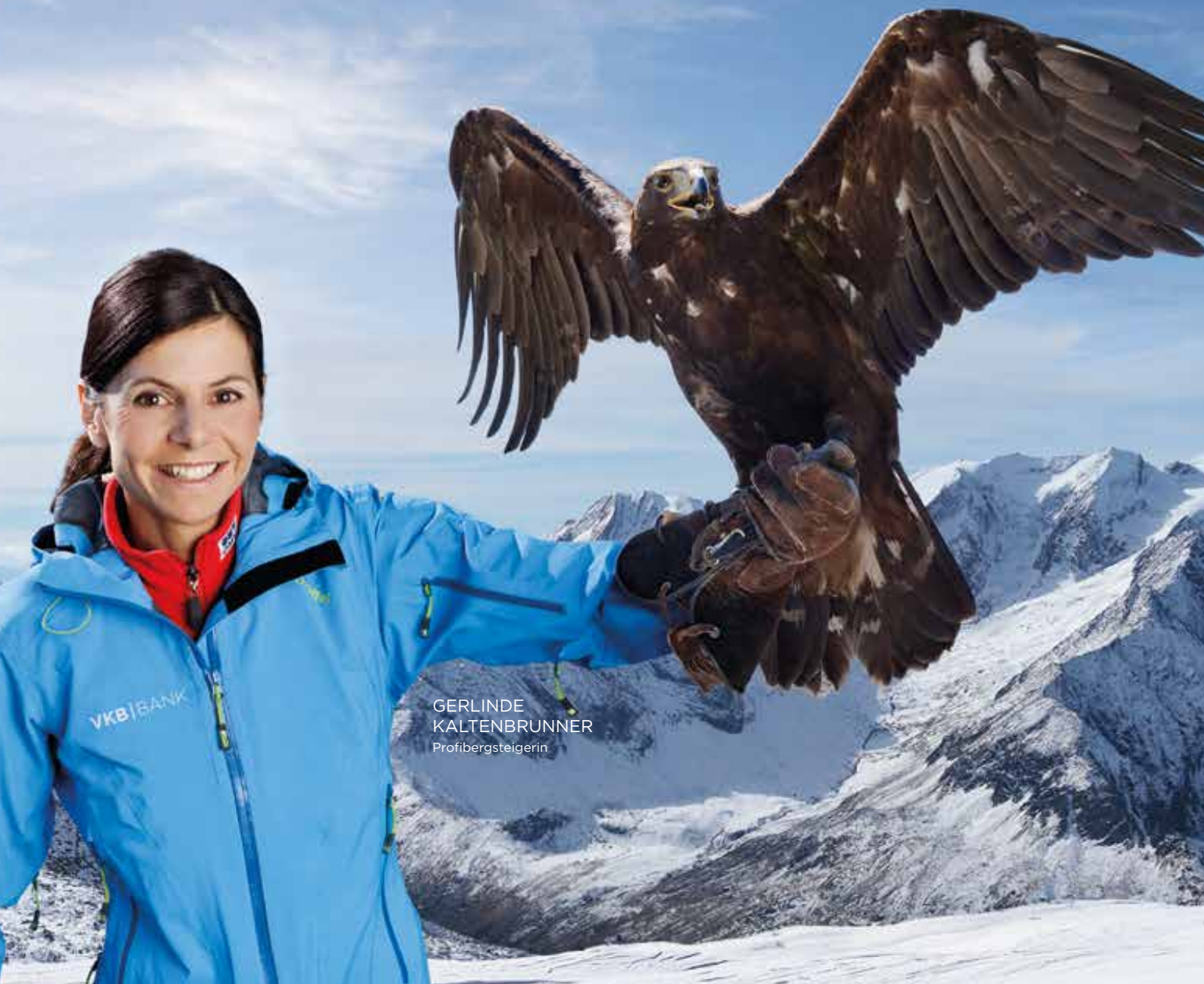
GERLINDE KALTENBRUNNER Profibergsteigerin

Die VKB-Bank ist Österreichs kapitalstärkste Bank*. Und überzeugt ihre Kunden mit einem Leistungsspektrum, das seinesgleichen sucht: Gelebte Unabhängigkeit, freier Handlungsspielraum bei allen Entscheidungen, absolut objektive Kundenberatung, das breite Angebot an weltweit führenden Finanzprodukten und ein Höchstmaß an Kundenorientierung. Vorteile, die Ihnen Rückenwind verschaffen und beste Perspektiven bringen.