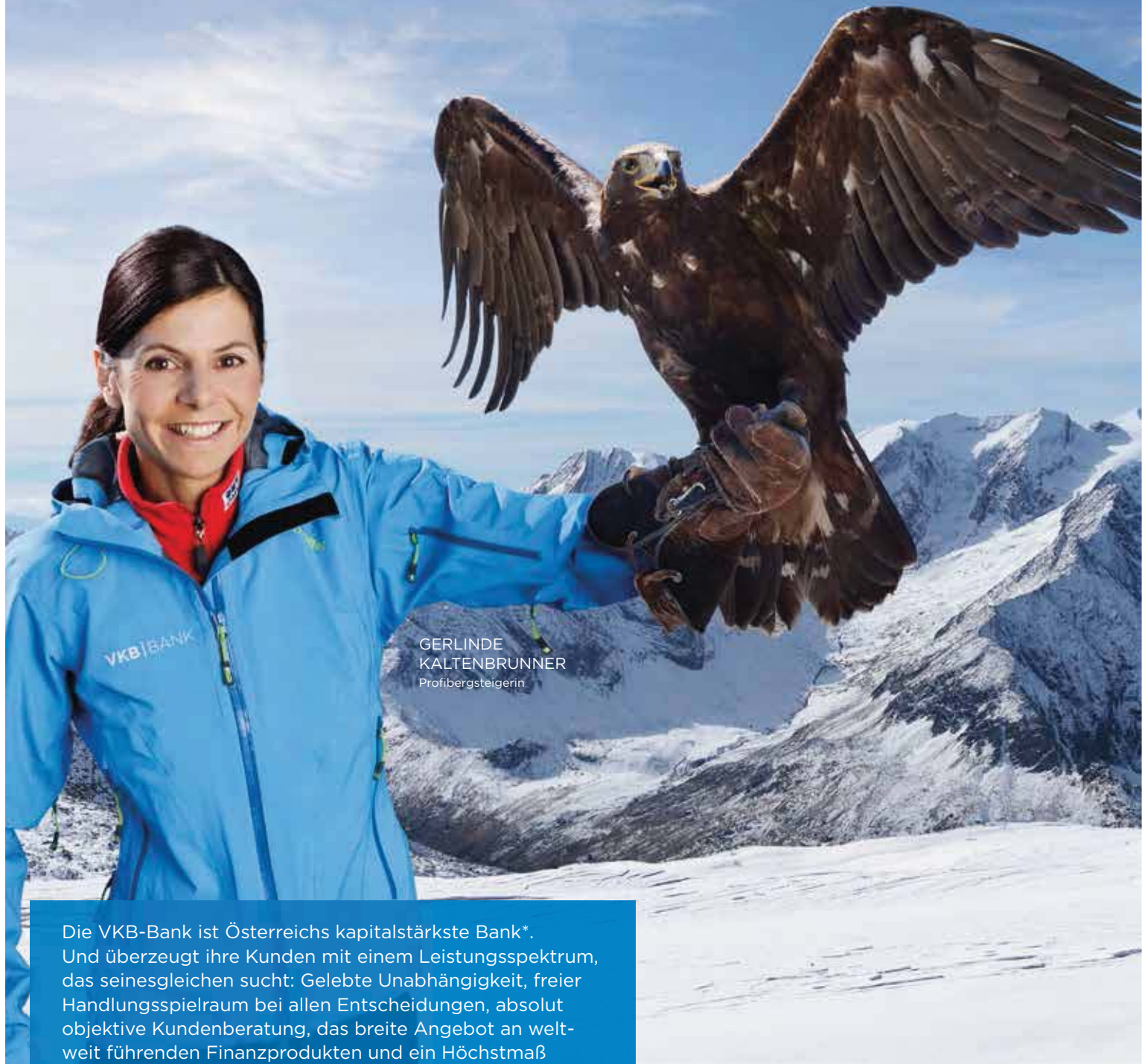
GERLINDE KALTENBRUNNER Profibergsteigerin

Die VKB-Bank ist Österreichs kapitalstärkste Bank*. Und überzeugt ihre Kunden mit einem Leistungsspektrum, das seinesgleichen sucht: Gelebte Unabhängigkeit, freier Handlungsspielraum bei allen Entscheidungen, absolut objektive Kundenberatung, das breite Angebot an weltweit führenden Finanzprodukten und ein Höchstmaß an Kundenorientierung. Vorteile, die Ihnen Rückenwind verschaffen und beste Perspektiven bringen.